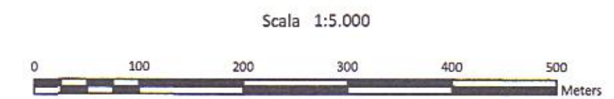
Tavola E: Carta di Uso del suolo